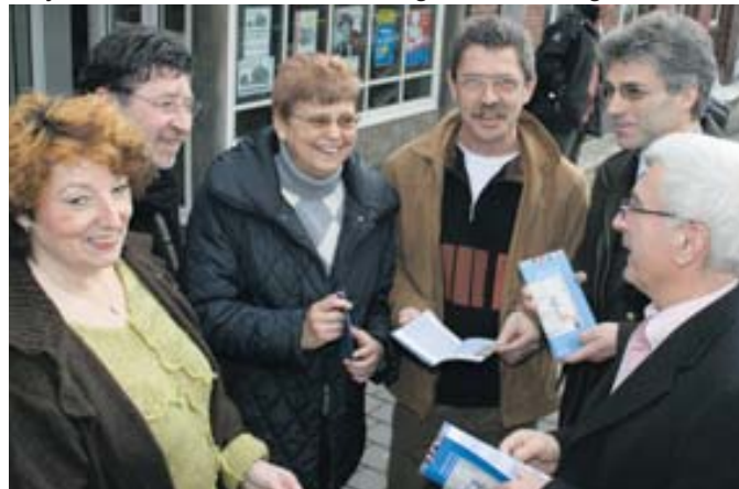
Klaus Lorig mit Privatvermietern

Oberbürgermeister Klaus Lorig appellierte an die privaten Vermieter, sich klassifizieren zu lassen. Eine Klassifizierung ist drei Jahre lang gültig. Danach muss das Privatzimmer oder die Ferienwohnung neu bewertet werden. Weitere Informationen erteilt die Stadt Völklingen unter der Telefonnummer 06898/ 13-2300 (Mike Kind, Fachbereich Wirtschaftsförderung/ Tourismus). Das neue Übernachtungsverzeichnis ist ab sofort in der Tourist-Information im Alten Bahnhof erhältlich.