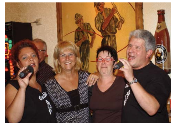
Überall gute Stimmung: Kneipenfestival 2007

Verkehrsbetriebe richten einen kostenfreien Bus-Shuttle-Service, den sog. „Festival-Express“, ein. Nach einem Sonder-Fahrplan wird der „Festival-Express“ Haltestellen in der Nähe bzw. die Gaststätten selbst anfahren und die Fahrgäste zu den anderen Spielorten bringen. Der Fahrplan ist im Veranstaltungsprospekt abgedruckt bzw. in den teilnehmenden Gaststätten ausgehängt. Weiterhin bietet die Funktaxizentrale Völklingen AST-Sammelfahrten mit ihren Taxen an. Informationen hierzu in den teilnehmenden Gaststätten.