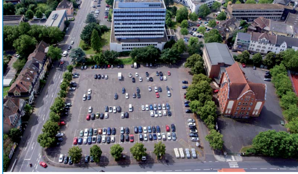
Völklinger Rathaus und Hindenburgplatz aus der "Vogelperspektive" gesehen.

notwendig, diese Bäume mit der Maßgabe, dass spätestens im Frühjahr 2018 eine entsprechende Ersatzpflanzung erfolgt, zu entfernen. Bezüglich der Ersatzpflanzung ergeben sich folgende