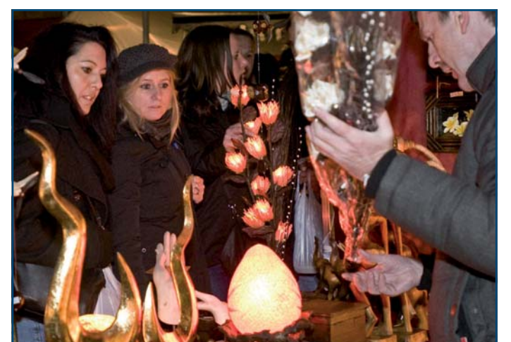
Viele Verkaufstände laden zum Staunen und Kaufen ein