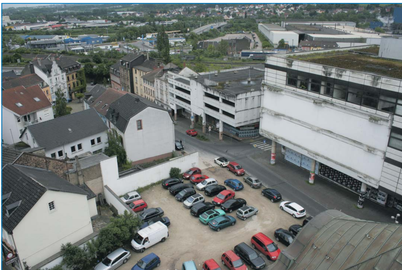
Blick vom Dach des Alten Rathauses auf den ehemaligen Kaufhof und das Umfeld

Zudem wurde die HU-Bau Ende April ausführlich und einvernehmlich mit der Firma „Modemark Röther“ abgestimmt, damit der Investor für seine geplanten Neubaumaßnahmen eine optimale Ausgangssituation in der Örtlichkeit vorfindet.