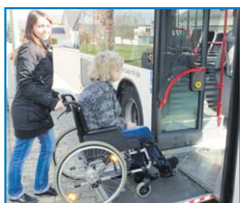
Niederflurgerechte Bushaltestellen sind u. a. für RollstuhlfahrerInnen eine große Hilfe.