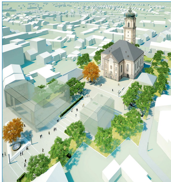
Entwurf aus der Vogelperspektive

Ausgehend von historischen Planunterlagen aus dem Jahr 1926 für das Kirchengebäude einschließlich des Umfeldes stellte Dipl.-Ing. Thomas Hepp die Ergebnisse seiner städtebaulichen Analyse in Bezug auf die vorhandenen Raumachsen, das Raumgefüge und die Wegebeziehungen vor. Auf dieser Grundlage erläuterte Dipl.-Ing. Luca Kist an Hand seiner Präsentation Ideen und Vorschläge für eine mögliche spätere Nutzung der einzelnen Teilbereiche des Planungsgebietes. Zentraler Bestandteil des angebotenen Entwurfsvorschlages ist eine einheitliche, aber zurückhaltende, eher sparsame Gestaltung des Platzes, der seitlichen Wege am Kirchengebäude bis hin zum Treppenaufgang an der Ostseite zur Moltkestraße hin, so dass im Ergebnis die Kirche sich auf einer Art „Teppich“ neu präsentieren könnte. Durch eine mögliche Verlage-