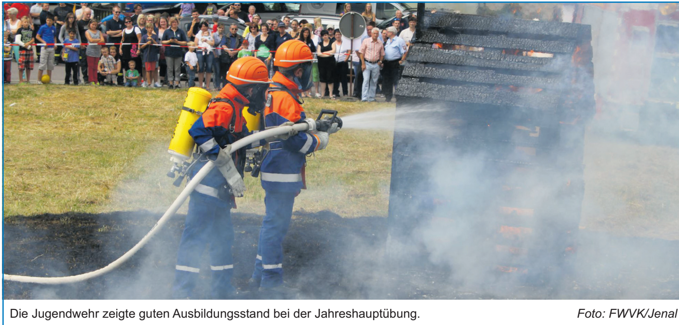
Die Jugendwehr zeigte guten Ausbildungsstand bei der Jahreshauptübung.

Für unverlangt eingesandte Artikel übernimmt die Redaktion keine Haftung.