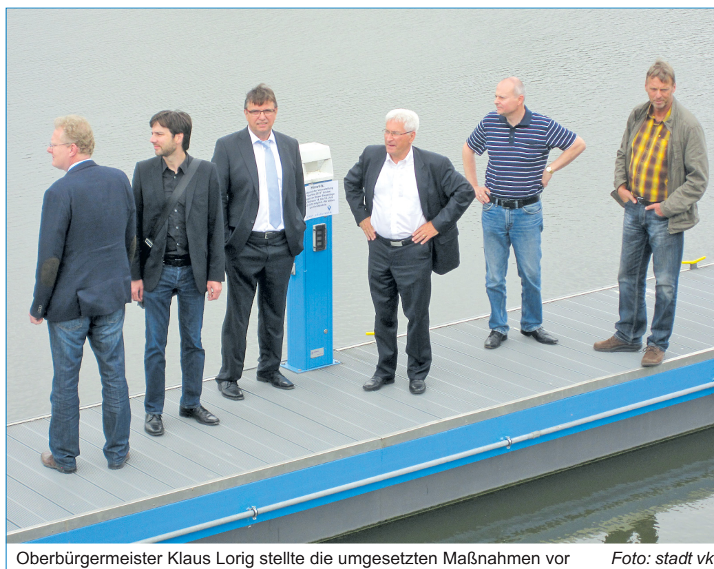
Oberbürgermeister Klaus Lorig stellte die umgesetzten Maßnahmen vor