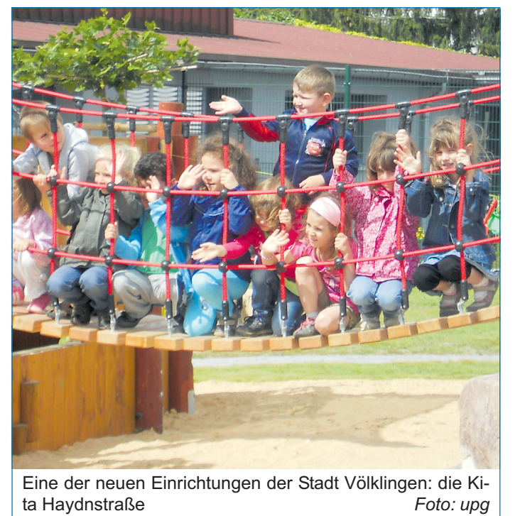
Eine der neuen Einrichtungen der Stadt Völklingen: die Kita Haydnstraße

gartens „St. Eligius“ besondere Priorität ein, die allerdings vom zuständigen Ministerium offensichtlich nicht geteilt werde. Dieser Eindruck dränge sich auf, da die Stadt entsprechende prüffähige Anträge zwar dort eingereicht habe, die von der Landesbehörde allerdings immer noch nicht geprüft und nicht beschieden seien. Die Stadtverwaltung hatte das Ministerium für Bildung und Kultur mehrfach auf die Dringlichkeit des Projektes St. Eligius hingewiesen, zuletzt am 5. Juni 2013 und hervorgehoben, dass an diese Maßnahme im Rahmen von Stadtumbau-West weitere Fördergelder gebunden sind, zum Beispiel der Abriss des Martin-Luther-Hauses und des Kolpinghauses.