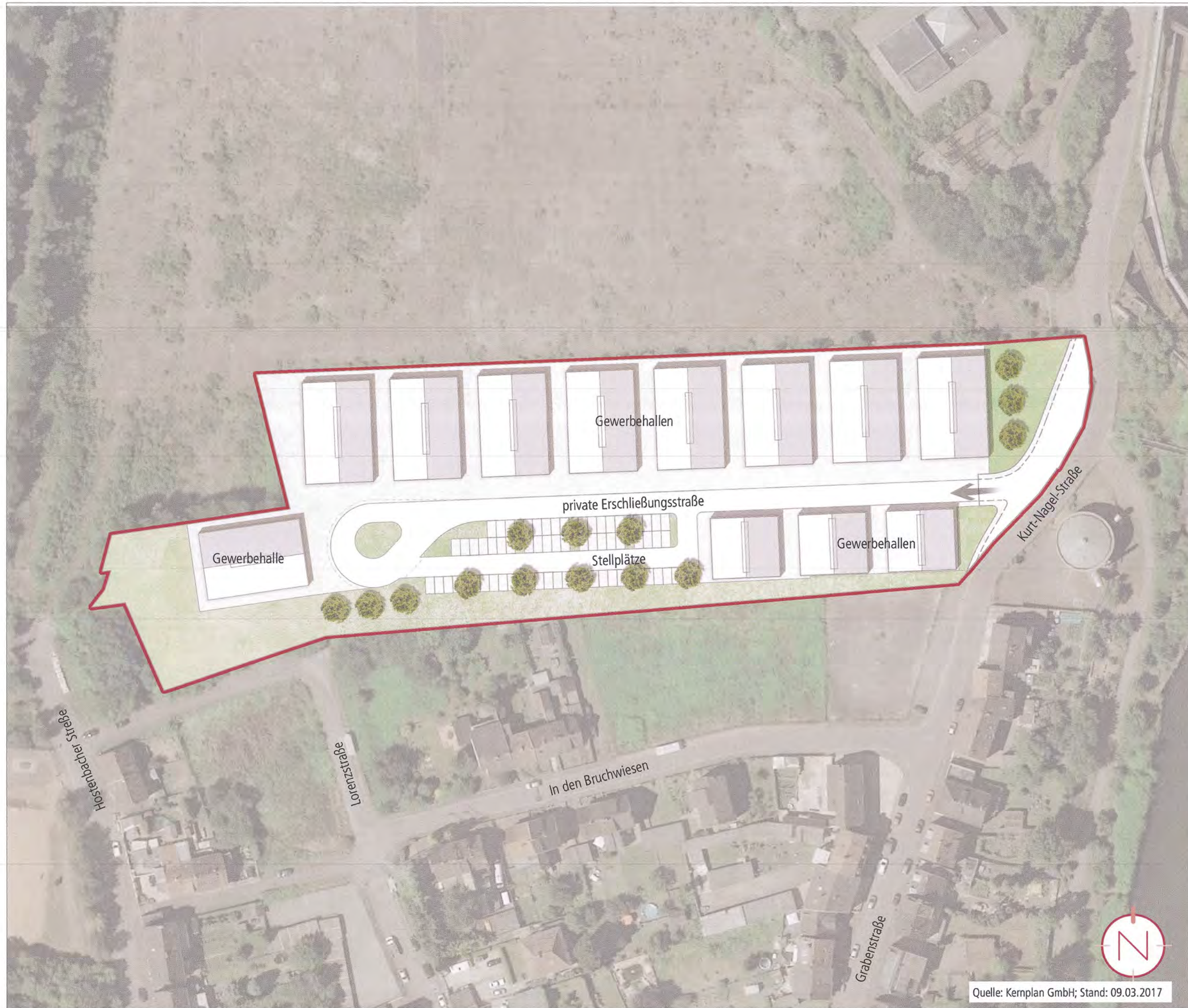
Quelle: Kemplan GmbH Stand: 09.03.2017