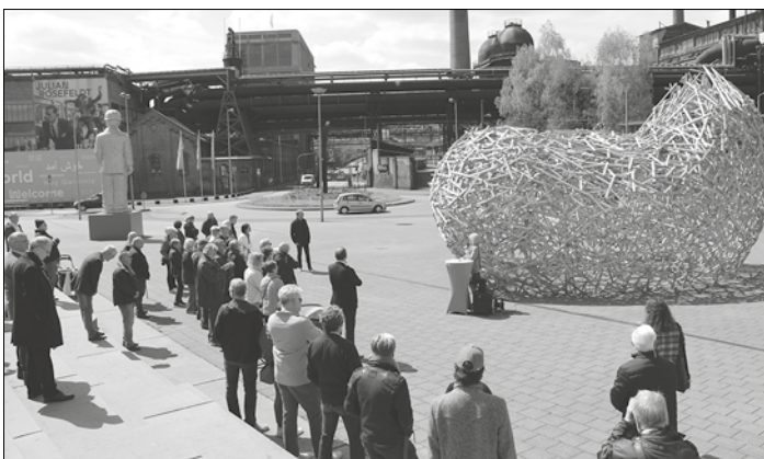
Bilder von der Einweihung des Kunstwerks „The Cloud“ auf dem Völklinger Platz im Juni 2023.