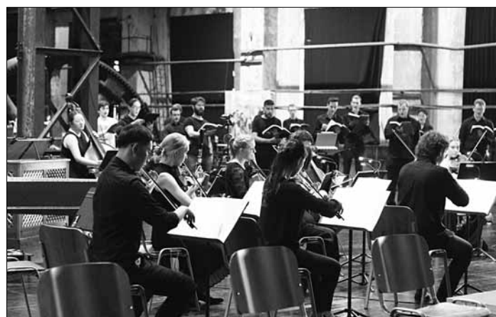
Konzert der HfM Saar im Weltkulturerbe Völklinger Hütte Aufführung der Johannes-Passion von Johann Sebastian Bach, 2021