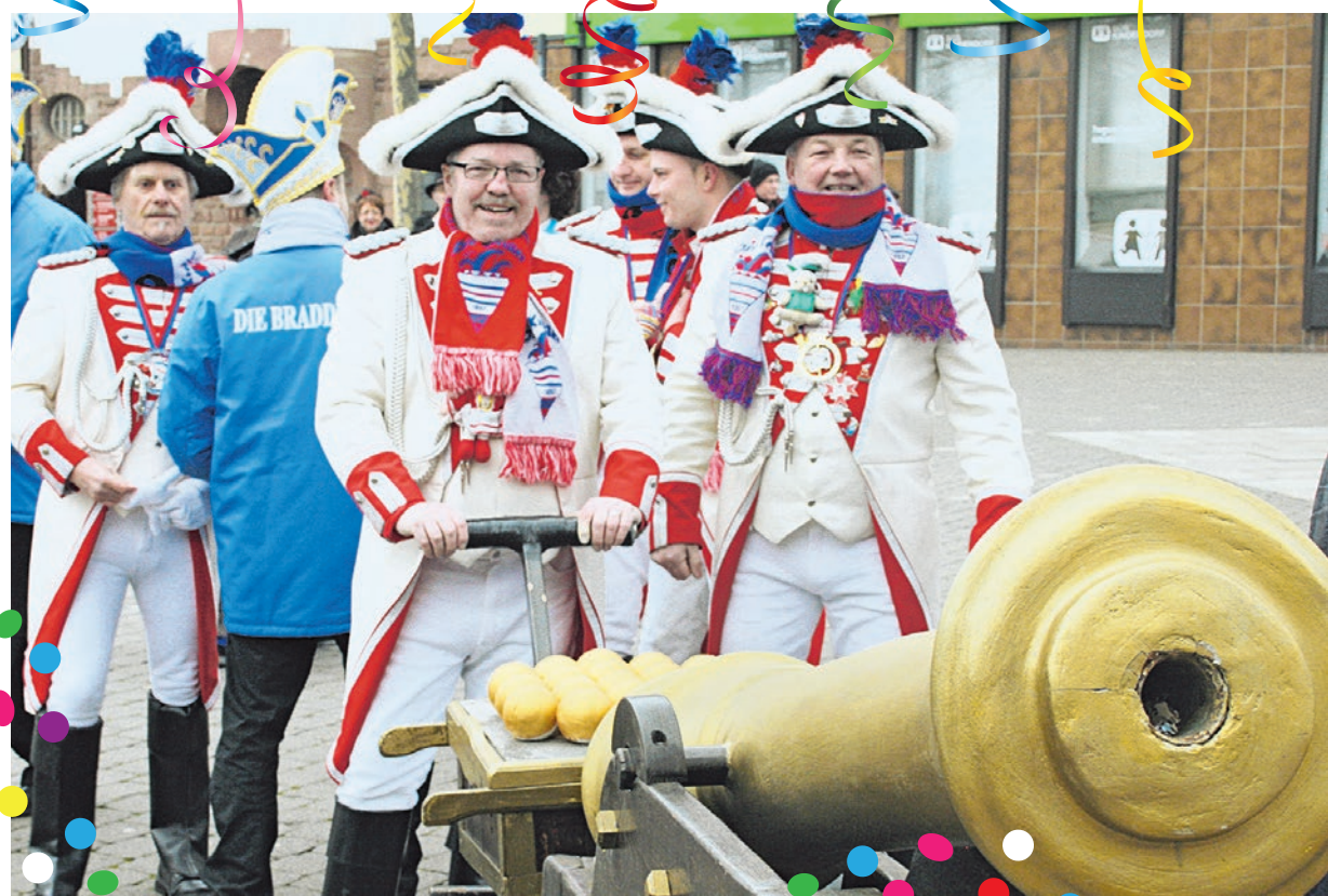
Schweres Geschütz wird beim Rathaussturm am Fetten Donnerstag aufgeföhren

Nach der Erstürmung lädt der Personalrat der Stadt Völklingen alle Bürgerinnen und Bürger zur großen Faschingsfete in das Foyer des Neuen Rathauses ein. Der Eintritt ist frei. Im Neuen Rathaus kann bei ausgelassener Stimmung getanzt und die Machterstürmung durch die Karnevalisten gefeiert werden.