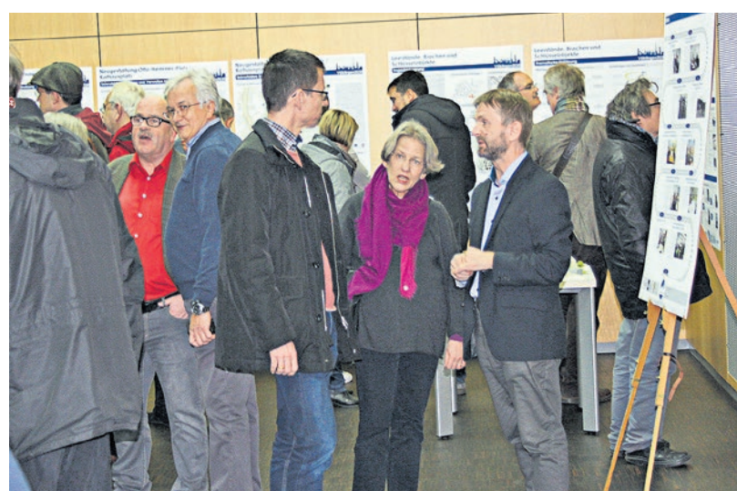
Viele interessierten sich für die Vorschläge der StudentInnen

Am Anfang stand jeweils die Analyse: Neben den Begehungen vor Ort wurden Interviews mit sogenannten Stadtextperten geführt, mit Vertretern aus Verwaltung, Politik, Handel, Wirtschaft, Kirche oder Gastronomie. Nach einer internen Zwischenpräsentation der Analyse-Ergebnisse im Dezember letzten Jahres im Neuen Rathaus wurde von den Studenten in Tageworkshops an der Universität