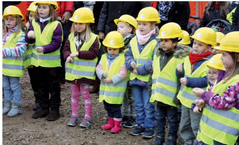
„Wer will fleißige Handwerker sehen...“

Um neue Bildungsangebote wahrnehmen zu können, wurde auch ein gemeinsamer, zwischengeschalteter Förderraum eingerichtet. Für ungestörte Elterngespräche steht in unmittelbarer Nähe zum Eingang ein abgeschlossener Bereich zur Verfügung. Im rechten Gebäudeteil