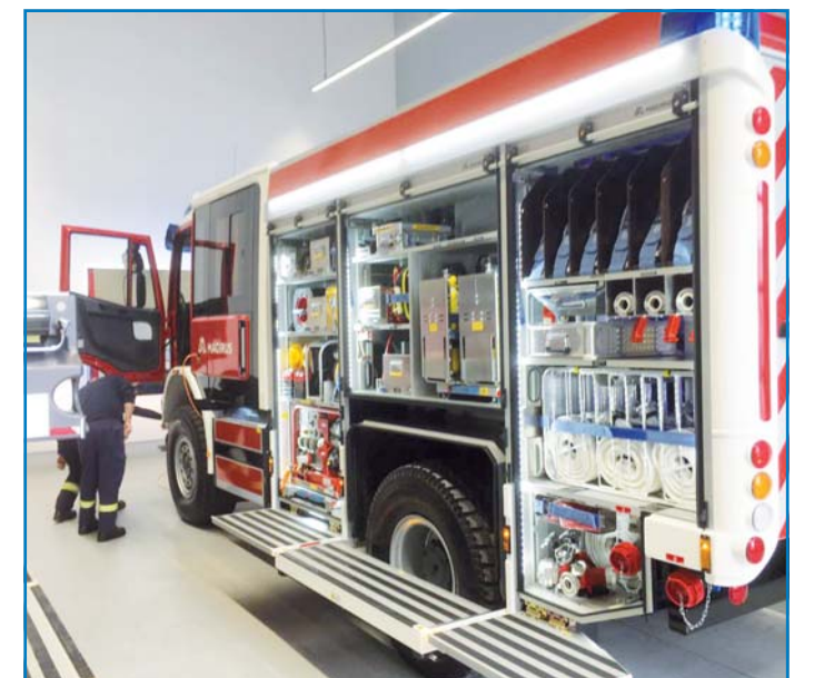
Innenansicht eines der neuen Löschgruppenfahrzeuge

Am 21. Februar fand die Lieferung der beiden neuen Löschgruppenfahrzeuge der Feuerwehr Völklingen statt. Zwei baugleiche Löschgruppenfahrzeuge wurden von der Firma Magirus an die Löschbezirke Wehrden und Fürstenhausen ausgeliefert. Die Fahrzeuge ersetzen in den Löschbezirken die in die Jahre gekommenen Löschgruppenfahrzeuge. Mit neuester Technik ausgestattet stellen die beiden Fahrzeuge eine Beschaffung zur Erhaltung der Leistungsfähigkeit der Völklinger Wehr und somit auch der Sicherheit der Völklinger Bürger dar. Die 300 PS starken Fahrzeuge auf Basis eines Iveco Fahrgestells bieten mit ihrem Aufbau der Firma Magirus Platz für insgesamt je neun Einsatzkräfte und technisches Gerät. Die geräumige Kabine ermöglicht den Einsatzkräften bei Brandeinsätzen das Anlegen der Atemschutzgeräte bereits während der Anfahrt. Dadurch kann wertvolle Zeit zur Menschenrettung gewonnen werden. Ausgestattet mit einer fest verbauten, sowie einer tragbaren Pumpe und eingebautem Tank kann das Fahrzeug direkt nach Eintreffen an der Einsatzstelle zum Löscheinsatz kommen. Durch die verladene „Tragkraftspritze“ kann Wasser sowohl an Orten wie Flussufern oder Weihern auch an unzugänglichen Stellen entnommen werden. Durch die elektronisch gesteuerte eingebaute „Feuerlöschkreiselpumpe“ ist ein unkompliziert gleichmäßiger Druck an den Strahlrohren gewährleistet. Mit diesen Fahrzeugen ist die Feuerwehr Völklingen für die nächsten Jahre bei Einsätzen bestens gerüstet.