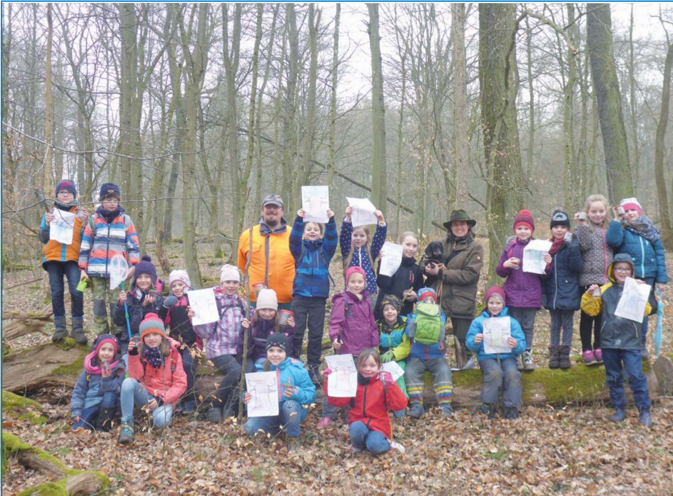
Frühlingserwachen im Völklinger Stadtwald: Kinder auf Entdeckungstour

Für unverlangt eingesandte Artikel übernimmt die Redaktion keine Haftung.