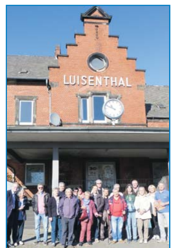
Bürgermeister Wolfgang Bintz (1.v.l.) und Mitglieder des Sicherheitsbeirates vor dem Bahnhof in Luisenthal

Der Sicherheitsbeirat ist ein unabhängiges und überparteiliches Gremium Völklinger Bürger/-innen, das die Stadtverwaltung Völklingen in Fragen der Sicherheit und der Kriminalprävention berät. Der Sicherheitsbeirat wurde 1998 gegründet. Er ist das am längsten kontinuierlich arbeitende Gremium dieser Art im Saarland. Der Sicherheitsbeirat kümmert sich um Probleme des subjektiven Sicherheitsgefühls in Völklingen, um die Verhinderung von Straftaten, Verhinderung von Straffälligkeit von Menschen - vorrangig Jugendlichen - sowie um Verbesserungen im Verkehrsraum. Dabei geht es um Drogenprävention, den Schutz vor Wohnungseinbrüchen sowie die Umgestaltung sogenannter Angsträume. Schwerpunkte sind momentan die Bemühungen um eine sauberere Stadt und um Ver-