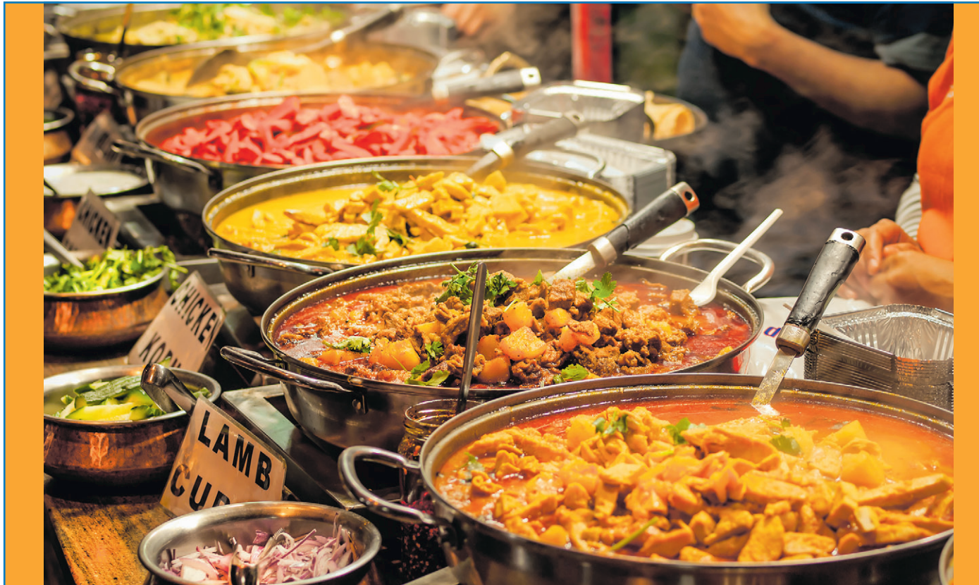
Kulinarische Genüsse aus aller Welt locken nach Völklingen

Für unverlangt eingesandte Artikel übernimmt die Redaktion keine Haftung.