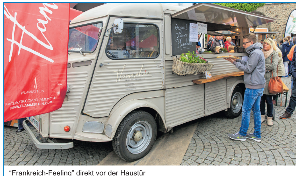
„Frankreich-Feeling“ direkt vor der Haustür

Samstags kann bis 21 Uhr und Sonntags bis 19 Uhr geschlemmt werden. Los geht es an beiden Tagen um 11 Uhr. Weitere Infos unter www.streetfood-tour.de .