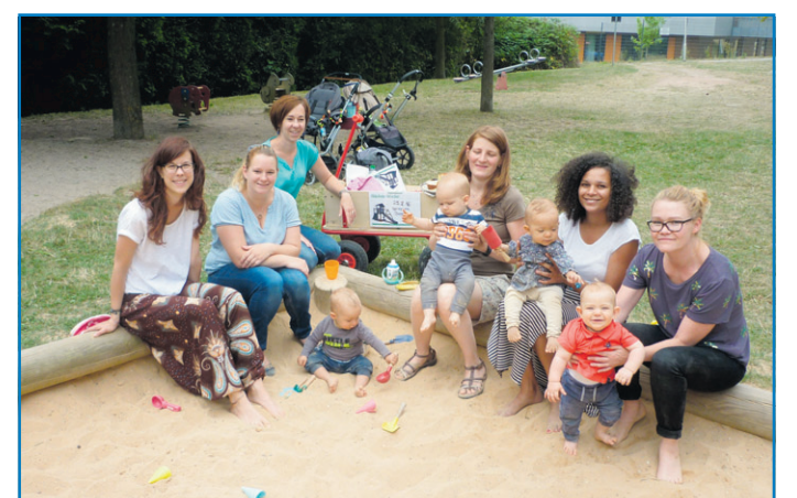
Strahlende Gesichter im Sandkasten des Spielplatzes am Völklinger Sauerbruchweg