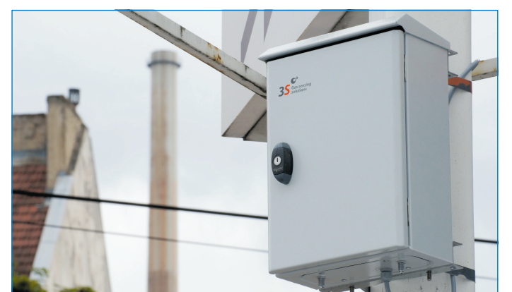
Die Außenmessstation 3S-OdorCheckerOutdoor nimmt rund um die Uhr Umweltdaten auf. Durch Vergleich mit menschlichen Wahrnehmungen kann der Verlauf von störenden Einflüssen aufgezeichnet und objektiv ausgewertet werden.

Zweite Phase der Geruchsüberwachung von April bis Juli 2015