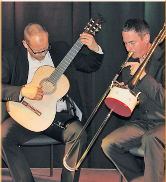
Duo von Grafenstein & Munzert

Am 16. April geht es in der Serie Carbon & Stahl mit Laurent Kremer weiter. Dieses Mal stehen die Akustik-Gitarre und Chansons im Mittelpunkt.