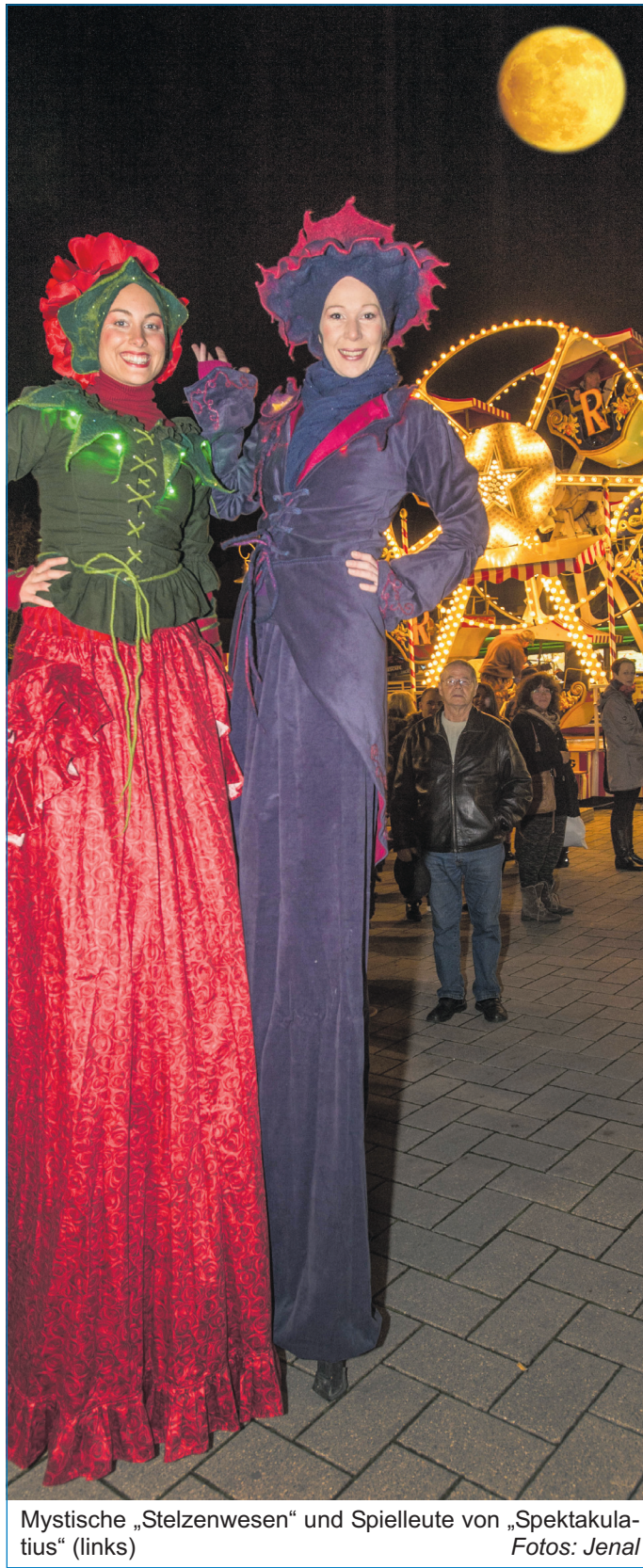
Mystische „Stelzenweser“ und Spielleute von „Spektakulatus“ (links)

dass der Mondscheinmarkt von der Bevölkerung so gut angenommen wird: „Der Mondscheinmarkt hat sich zu einem echten Highlight entwickelt. Und künftig wollen wir mit dem Frühjahrsmarkt im Frühjahr eines Jahres auch einen attraktiven Gegenpol schaffen.“