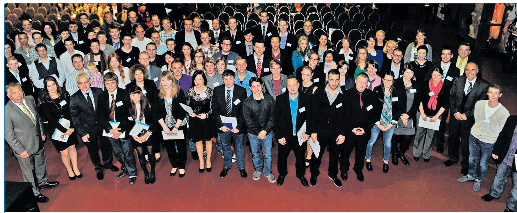
Absolventen bei der Bestenfeier der IHK