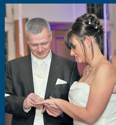
Ein Brautpaar, das sich bei Mondschein traute.

Wie in den vergangenen Jahren haben alle Besucher des Mondscheinmarktes die Gelegenheit, in der Pause zwischen 19 und 19.30 Uhr das festlich dekorierte Alte Rathaus zu besichtigen.