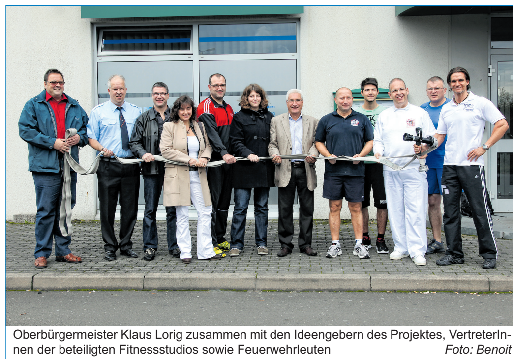
Oberbürgermeister Klaus Lorig zusammen mit den Ideengebern des Projektes, VertreterInnen der beteiligten Fitnessstudios sowie Feuerwehrleuten

Die Projektidee: Auf Grund unterschiedlicher Einflüsse ist es nicht mehr allen Feuerwehrleuten möglich, die für die Arbeit mit Atemschutzgeräten notwendige und körperlich sehr fordernde Tauglichkeitsprüfung der Berufsgenossenschaften, die sogenannte G 26.3, abzulegen.