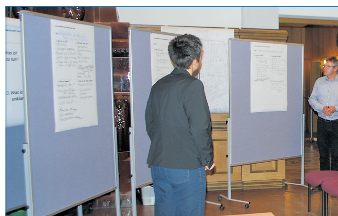
Auftaktveranstaltung der Zukunftswerkstatt Nördliche Innenstadt im Alten Rathaus

Anknüpfend an die Quartiersversammlung im vergangenen Jahr werden nun im Rahmen von insgesamt vier