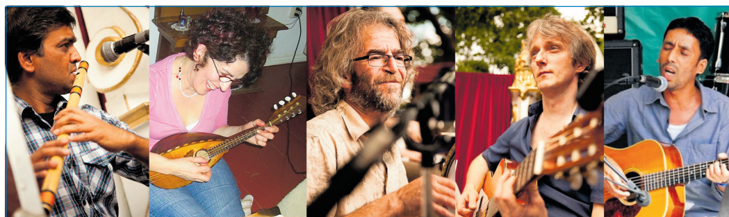
Ebenfalls dabei: die Gruppe „Integra“

Es verspricht ein sehr spannendes und interessantes Programm zu werden, das die Integrationsbeauftragte der Stadt Völklingen organisiert hat: Vom 31. August bis zum 9. September findet in der Weltkulturerbe-Stadt die Woche der Toleranz und Vielfalt statt. Am Freitag, dem 31. August, um 17 Uhr startet die Veranstaltungsserie offiziell mit dem Konzert der beiden Gruppen „Integra“ und „Back to India“ aus Berlin in der Kulturhalle im Stadtteil Wehrden. Die Musik von „Integra“ ist gemischt und vielfältig wie die Menschen in Berlin. Balladen aus Aserbeidschan, schnelle Tänze vom schwarzen Meer, Rembetiko, die Musik der emigrierten Griechen, bulgarische Tanzmusik, klassische türkische Musik, Lieder und Instrumentalstücke aus dem Iran gehen Hand in Hand mit indischen und europäischen Rhythmen. Wer nicht tanzen wird dennoch auf seine Kosten kommen, denn Integra überzeugt mit Charme und Spielfreude. Die auch auftretende Gruppe