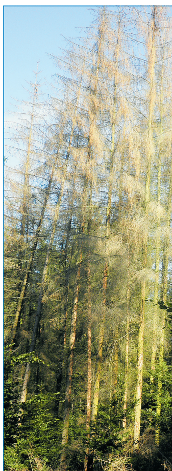
Vom Borkenkäfer geschädigte Bäume

Der Fachdienst 44, Forstwirtschaft der Stadt Völklingen hat im Stadtwald im Bereich Fürstenhausen mit Holzerntemaßnahmen in Fichtenbeständen begonnen. Diese sind durch jahrelange Borkenkäfer- und Sturmkalamitäten schwer geschädigt und sogar Teile bereits abgestorben. Der Borkenkäfer ist einer der gefährlichsten Schädlinge in der Forstwirtschaft. Bei günstigen Witterungsverhältnissen und ausreichendem Brutmaterial kann es zu einer Massenvermehrung kommen. Die Käfer bohren sich in der Rinde von noch lebenden Bäumen, legen dort ihre Eier ab und ernähren sich vom Bast, wodurch der Baum in der Regel abstirbt. In Fürstenhausen sind sehr viele Bestände durch den Borkenkäfer geschädigt. Um ein Übergreifen des Schädlings auf die noch gesunden Fichtenbestände zu vermeiden, ist es wichtig die befallenen Bäume zu entnehmen. Teilweise sind die Bestände allerdings so stark geschädigt, dass ein kompletter Auszug der Fichte unabdingbar ist. Die hierbei