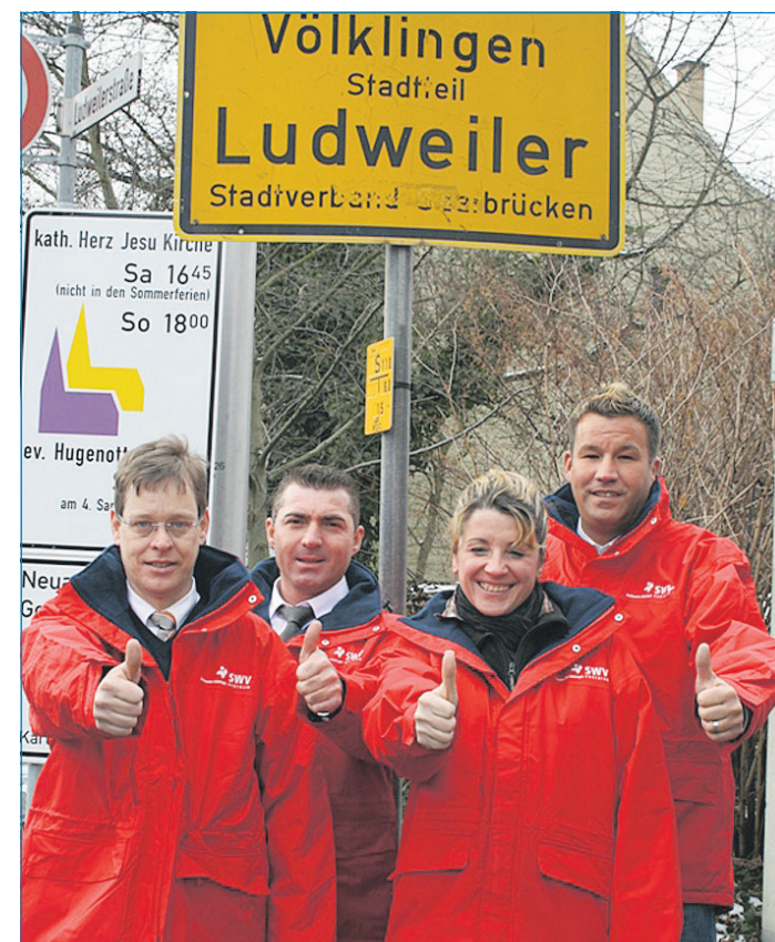
Die Mannschaft der Stadtwerke Völklingen, die im Sektor Telekommunikation berät