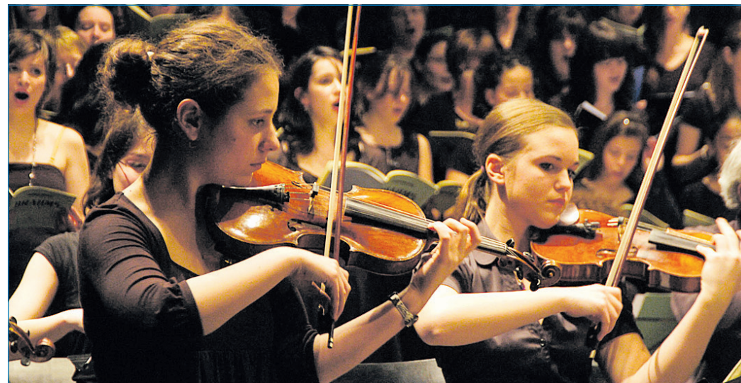
Klassikgenuss in der Gebläsehalle in Völklingen

Das Konzert wird seit Jahren im Rahmen der Städtepartnerschaft zwischen Forbach und Völklingen gefördert und ist ein hervorragendes Beispiel für gelebte grenzüberschreitende Zusammenarbeit zwischen deutschen und französischen Schulen.