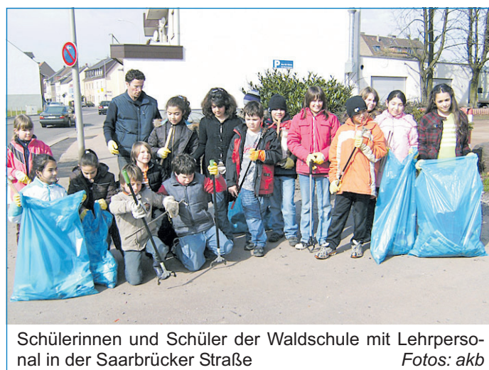
Schülerinnen und Schüler der Waldschule mit Lehrpersonal in der Saarbrücker Straße