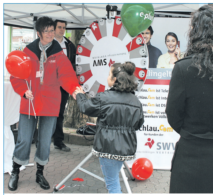
Eine kleine Völklingerin bei der Tauschaktion

Die Stadtwerke haben sich seit dem 1. März einer saarlandweiten Wette angeschlossen. Sie wetten gemeinsam mit ihren Partnern, allein durch den Austausch alter Glühbirnen in Energiesparlampen, drei Millionen Kilogramm Kohlenstoffdioxid in diesem Jahr einsparen zu können.